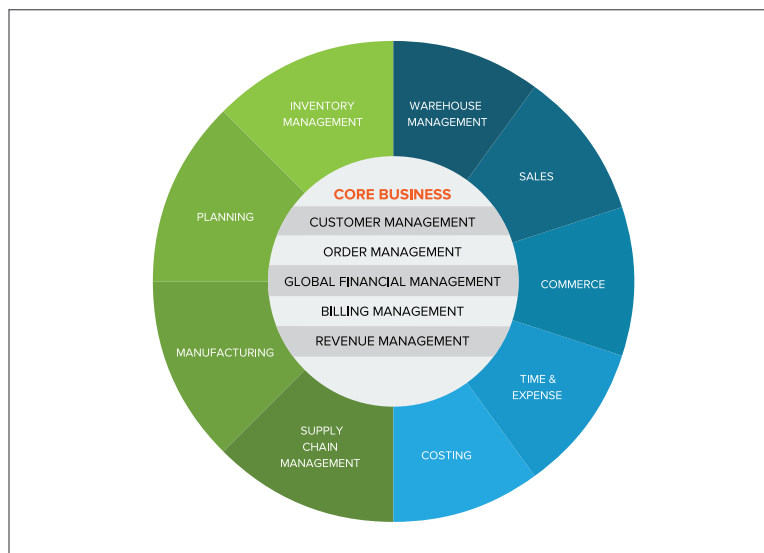
Afbeelding 1: NetSuite biedt een volledige bedrijfsoplossing voor fabrikanten.

NetSuite is een cloud applicatie, zodat fabrikanten onmiddellijk kunnen profiteren van de uitgebreide functionaliteit, tegen lagere aanloopkosten dan bij traditionele benaderingen.